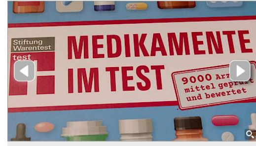
Stiftung Warentest präsentiert das neue Nachschlagewerk „Medikamente im Test“: Mehr als 9.000 wertet.

Deniz Cicek-Görkem, 09.10.2017 17:33 Uhr